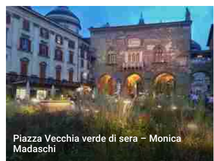
Piazza Vecchia verde di sera - Monica Madaschi