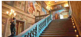
Un bel tour dentro Palazzo Moroni Ora che è tempo di Dimore&Design