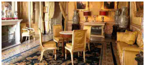
Le dimore storiche di Bergamo e il loro incontro con il design